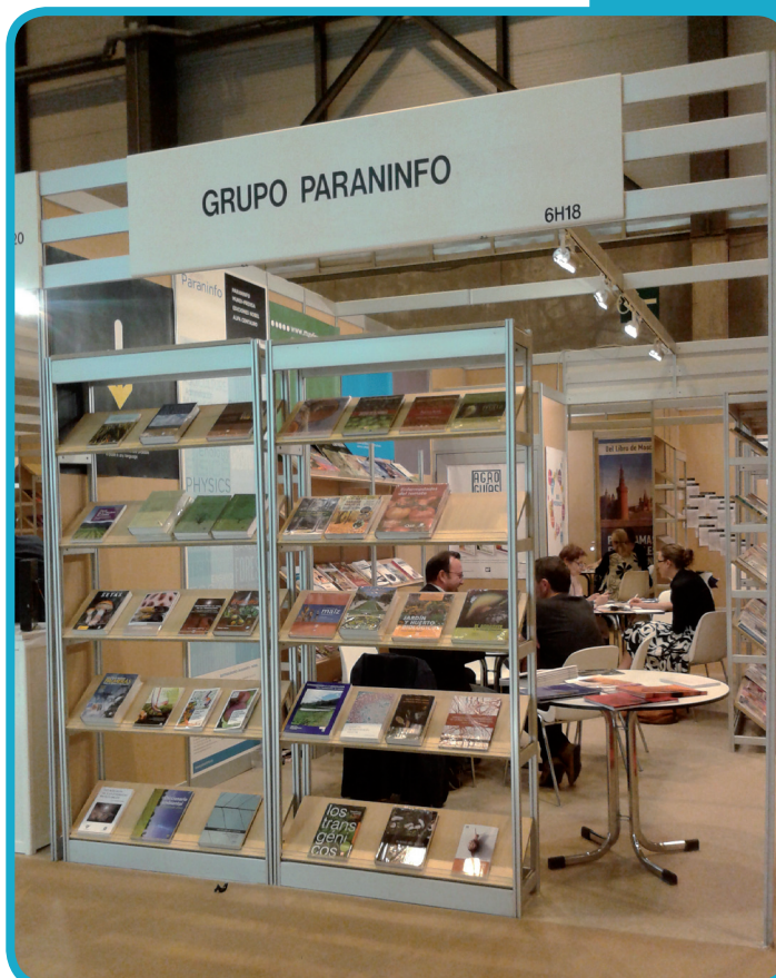
Grupo Paraninfo en la Feria de LIBER.

El Grupo Paraninfo nace en octubre de 2008 cuando Ediciones Nobel, propiedad de la familia García Cervero, compró el 100% de Ediciones Paraninfo, dos sellos muy diferentes, pero con un nexo común, la profesionalidad y la excelencia. En esta adquisición, se incorporó además el sello editorial Alfa Centauro. Dos años después, se unió Mundi-Prensa, ampliando así la oferta formativa técnica y de divulgación, con el mismo espíritu de satisfacer las demandas de alumnos, profesores, profesionales y aficionados.